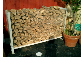
すべて乾燥済み薪(ナラ)です